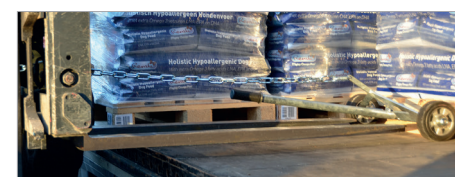
Aantrekken van de pallet met de vorkheftruck in de "eerste rij"