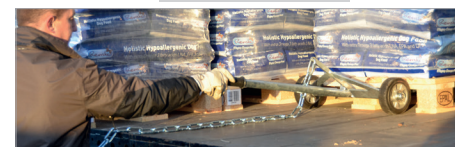
Inzetten in de pallet