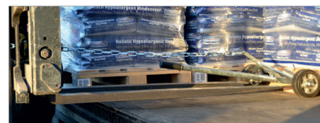
Ramener la palette avec le chariot élévateur pour être en première ligne