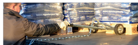
Positionnement dans la palette