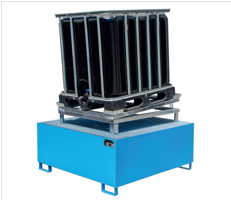
IR-1 auf 1000-l-Auffangwanne