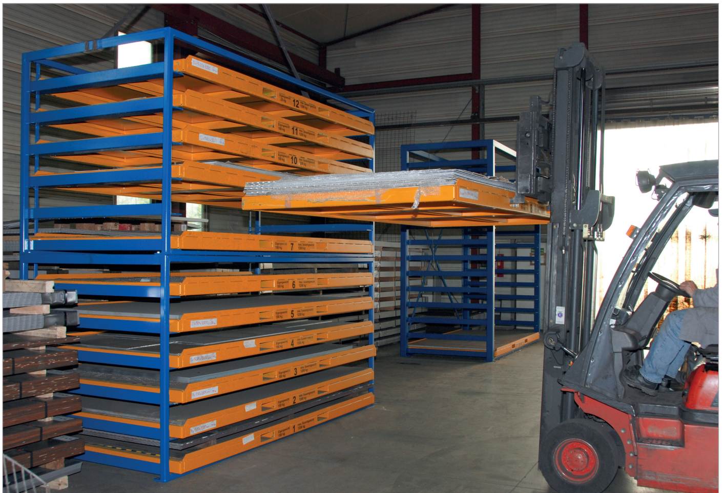
KBR 3 - 2-gestapeld