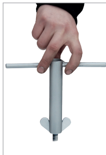
Sleutel voor vleugelmoeren