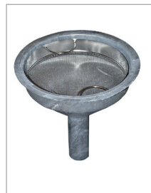
Trechter met zeef van roestvrij staal