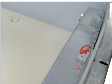
Trechter en zeef van roestvrij staal