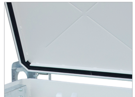
Deksel d.m.v. veren ondersteund en met binnenrandafdichting