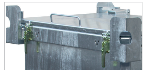
Kraanogen aan de binnenzijde van de stapelhoek