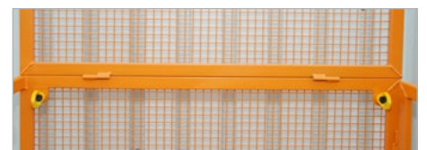
Point d'ancrage pour PSA (EPI)