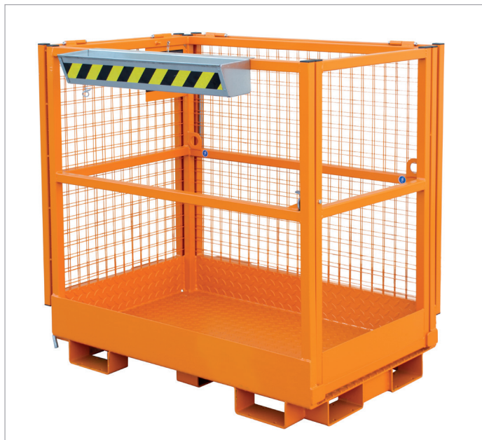
Platzsparende Lagerung durch beidseitig zurückgeklappte Schutzgitter