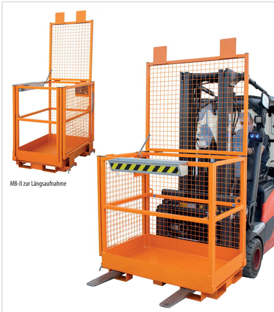
MB-II zur Längsaufnahme