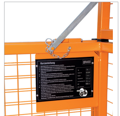
Chaînes de sécurité des grilles de protection amovibles Guide de démarrage rapide