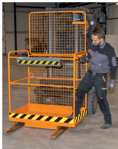
Einstieg durch Heben der Sicherungsstange