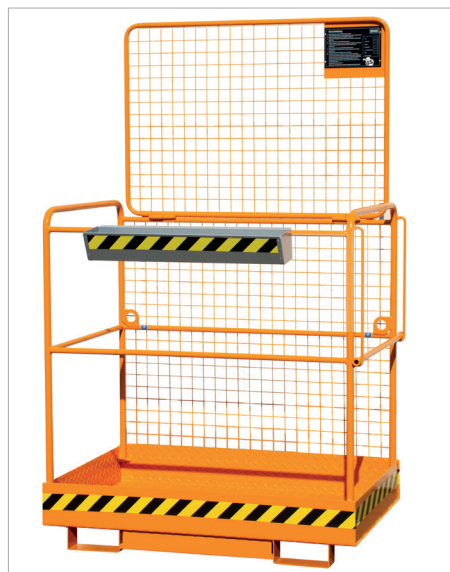
Accès par le biais de la barre de sécurité. Sécurisation automatique par gravité