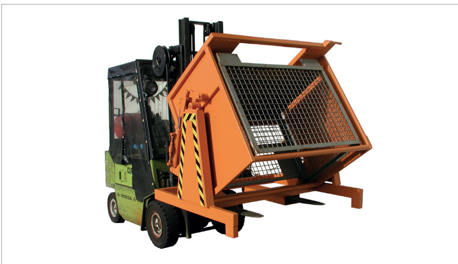
KGM mit Kippbremse

Mit jedem Gabelstapler schnell einsetzbar