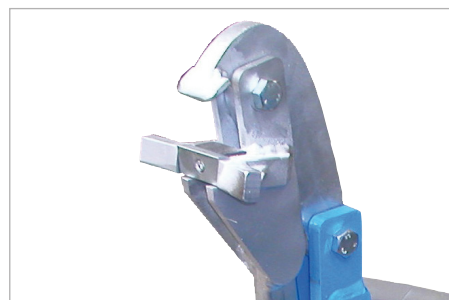
Large surface d'appui du bord du fût (RS/91)