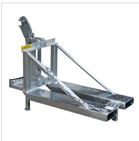
RS-I/M avec pieds-supports pour gerbeurs