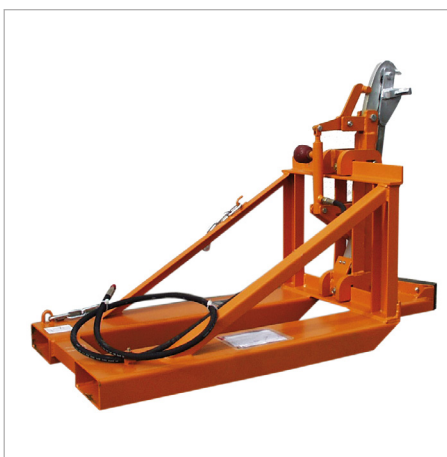
RS-I/91 équipé d'un serrage hydraulique sécurisé