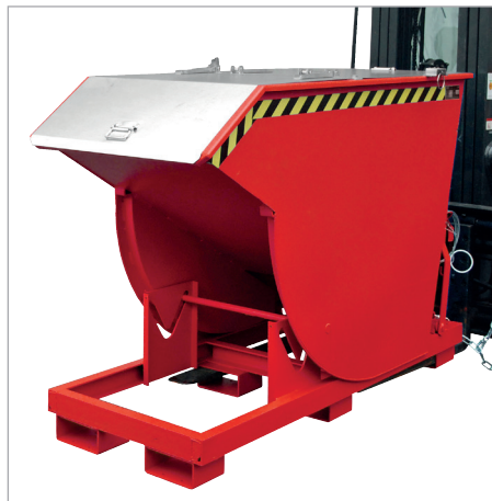
BKM mit Deckel