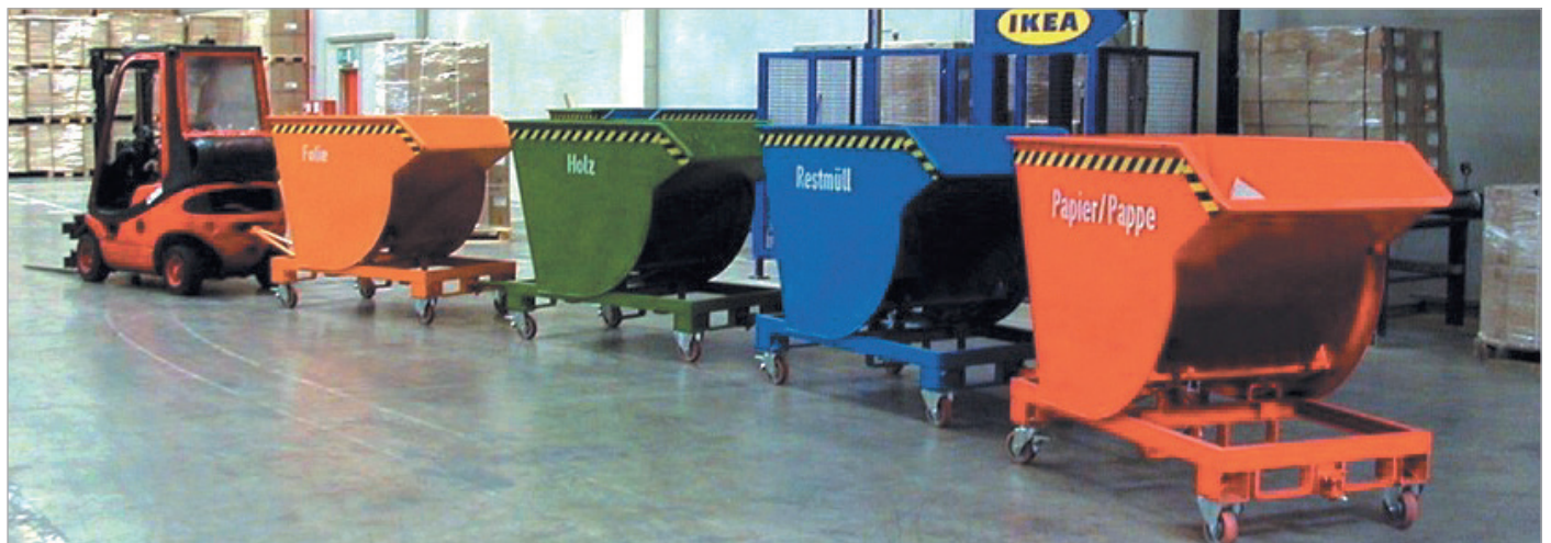
BKM mit Rollen und Anhängervorrichtung mit Deichsel