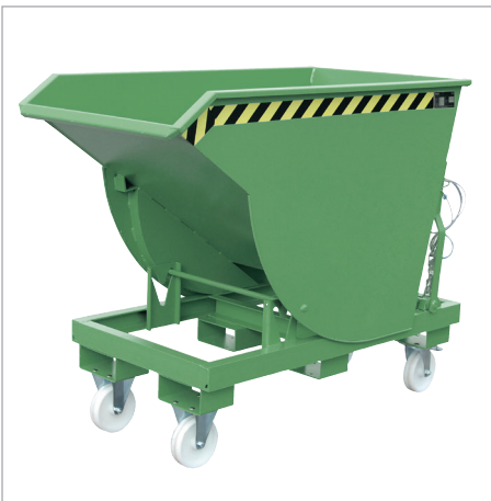
BKM mit Rollen