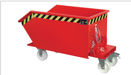
GU met wielen