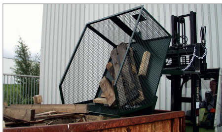
Speciale uitvoering: gascontainer GU-G