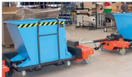
GU-RZ aan route-trein