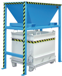
De ideale aanvulling! Vultrechters (zie pagina 37)