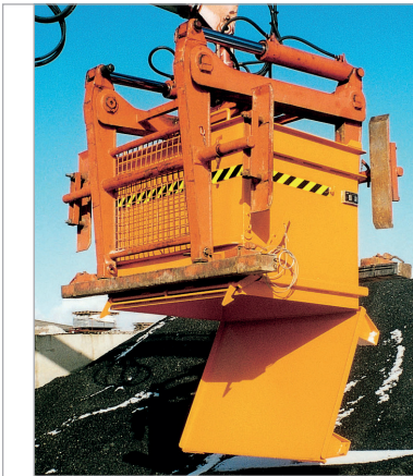
BC met steentangontgrendeling