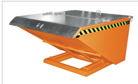
NK met deksel