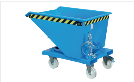
NK met wielen