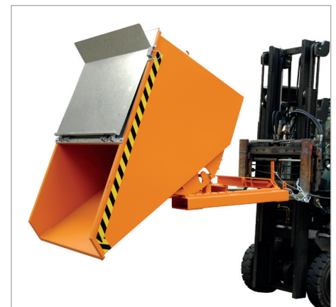
EXPO mit Deckel