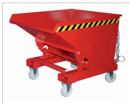
EXPO mit Rollen