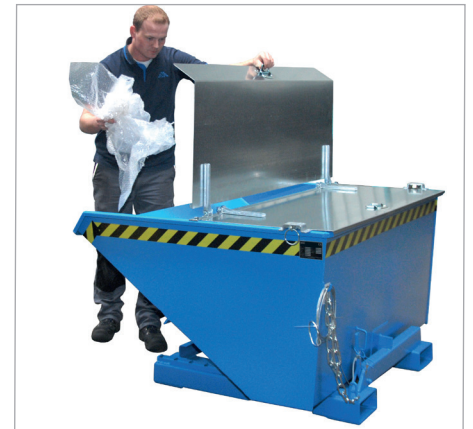
EXPO mit Deckel