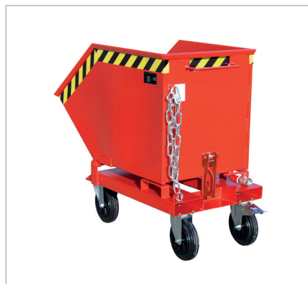
SKK à roulettes (en caoutchouc)