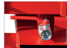
Robinet de vidange 1"