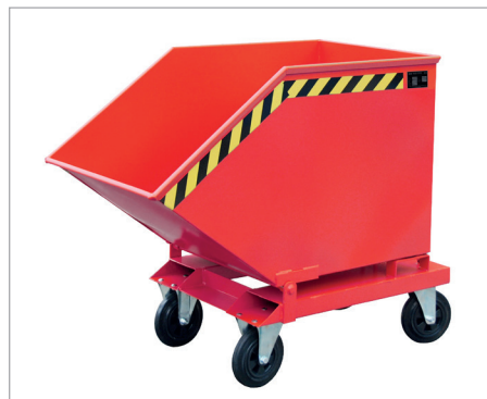
KK à roulettes (en caoutchouc)