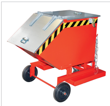
KW-ET mit Deckel