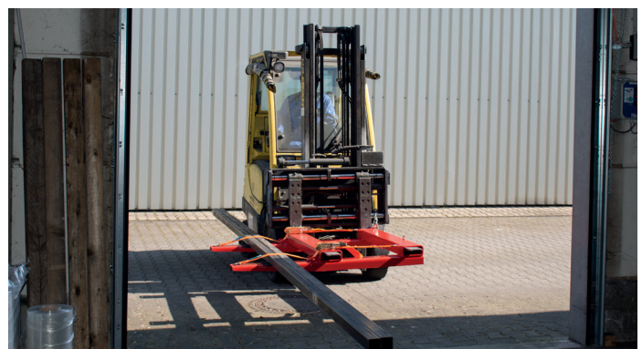
Eenvoudig passeren door poorten en gangen bij het transport van langgoedmateriaal met de LSL