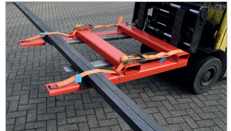
Opnamepositie voor laden en lossen