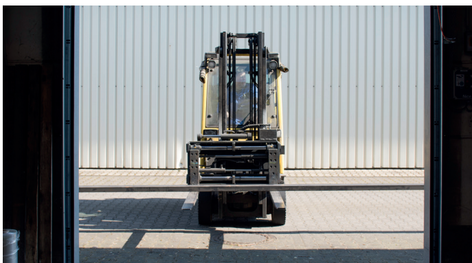
Transport van langgoedmateriaal door poorten is zonder LSL niet mogelijk