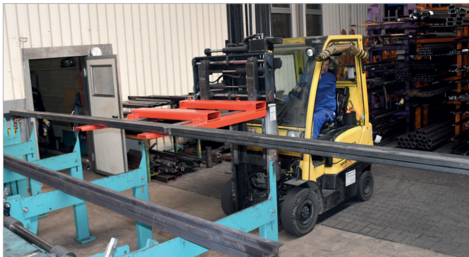
Opname van langgoedmateriaal