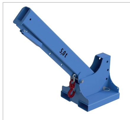
KTH-K in hoogte versteld