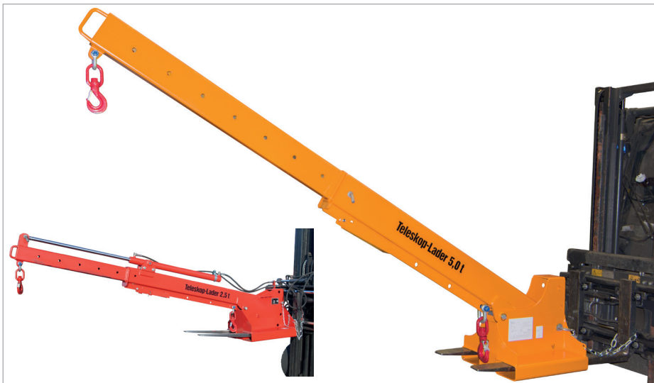
Hydraulisch uitgeschoven (KTH) (opties)