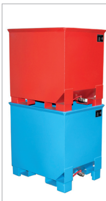
CS 30 stapelbaar