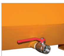
1" aftapkraan (CS)