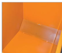
geperforeerde plaat (CS)