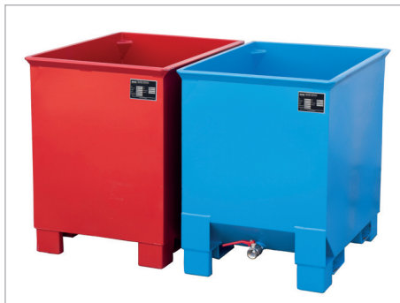
C 30 en CS 30