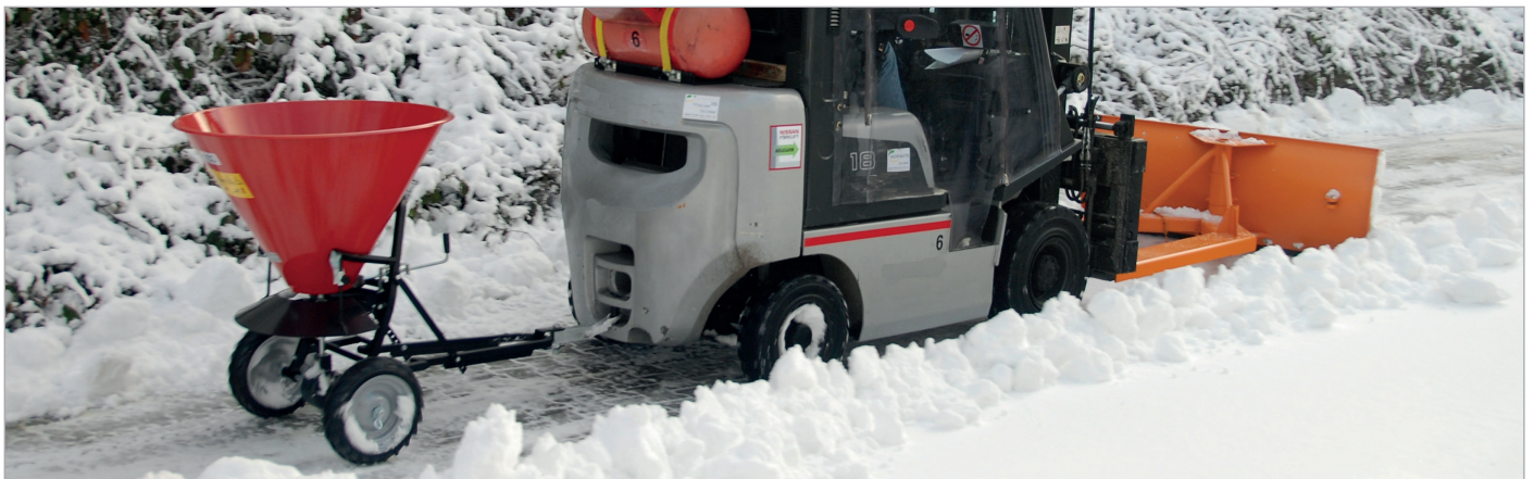
Chasse-neige SCH-G (voir page 56) avec STW 100