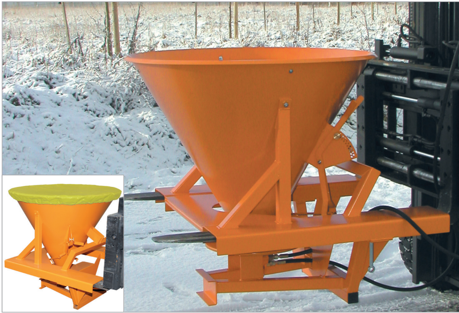
SH avec housse