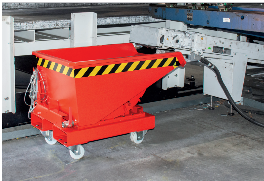
EXPO-E mit Rollen