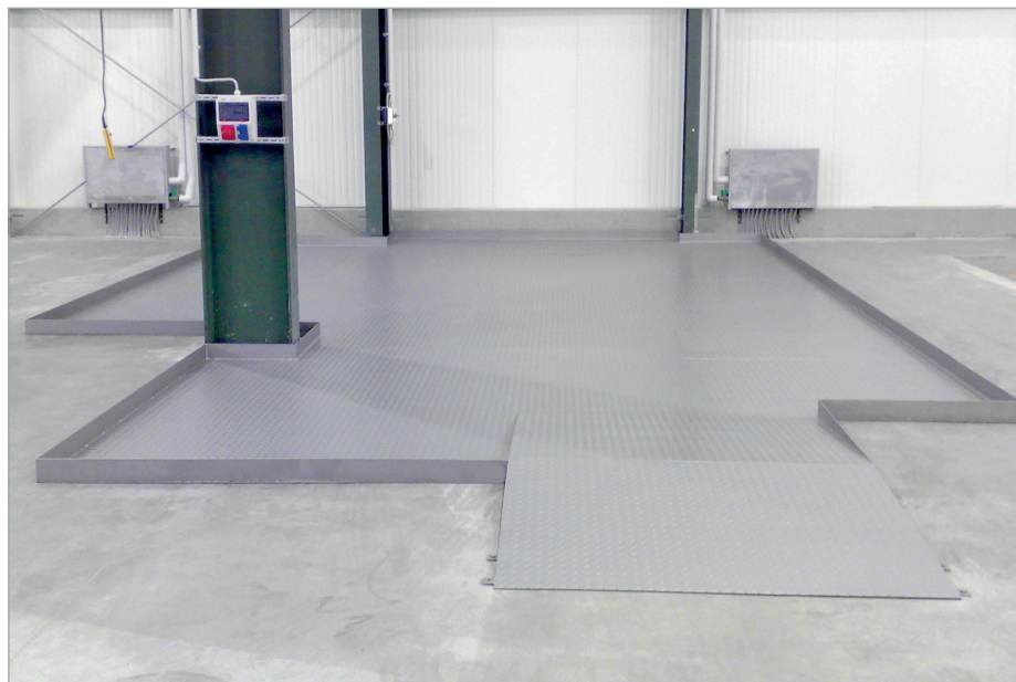
Revetement de protection du sol avec niche pour le pilier et rampe d'accès

D'après les exigences légales allemandes du «VAwS» et «WHG», les lieux de transvasement ainsi que les emplacements de chargeou déchargement pour tous polluants doivent disposer d'un système de retenue approprié. Nos revêtements de protection du sol répondent à ces exigences. En autres, les endommagements mécaniques du sol peuvent étre évités