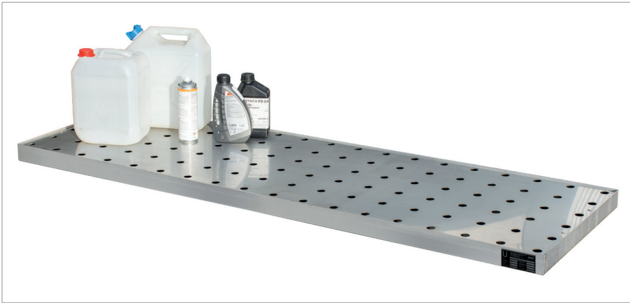
KGW 5/M V4A