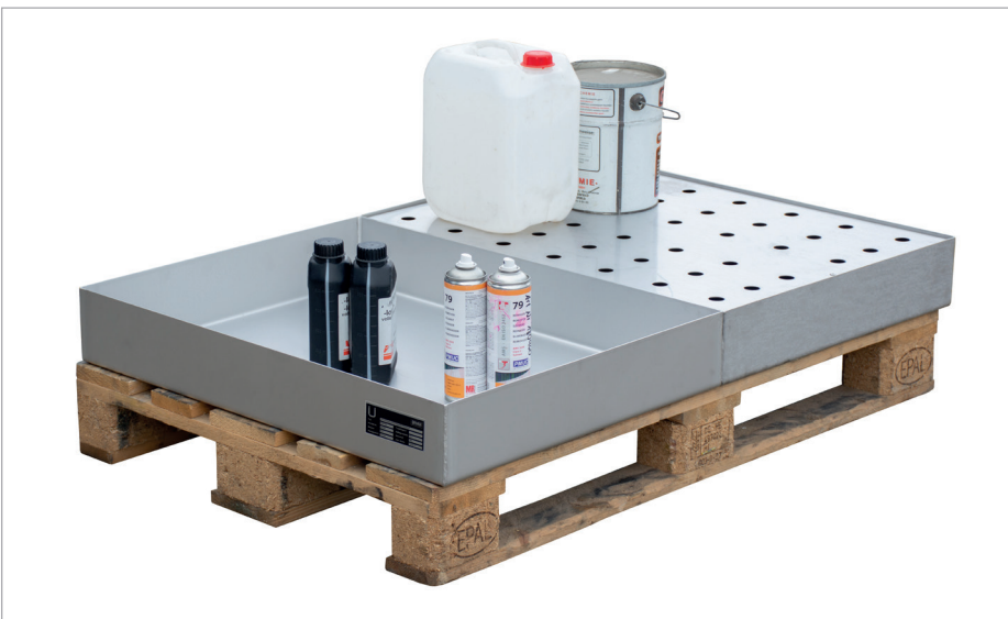
Auf Europalette 1200 x 800 mm: KGW-P 2 V4A und KGW-P 2/M V4A