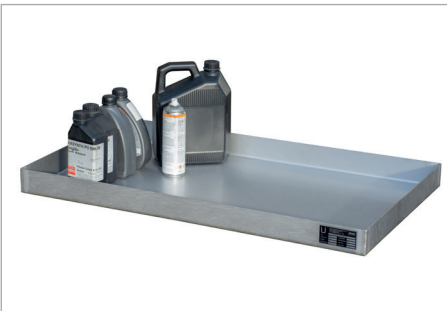
KGW 3 V4A