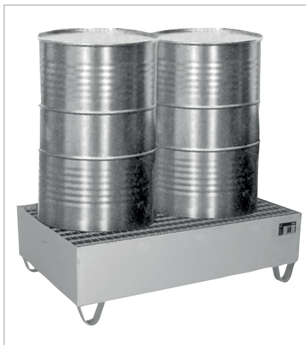
VAW-2 avec caillebotis (options)

Pour un stockage d'un max. de 4 fûts de 200 litres ou de max. 2 conteneurs IBC de 1000 litres remplis de matières agressives ou en combinaison avec des fûts de 60 litres ainsi que des petits récipients