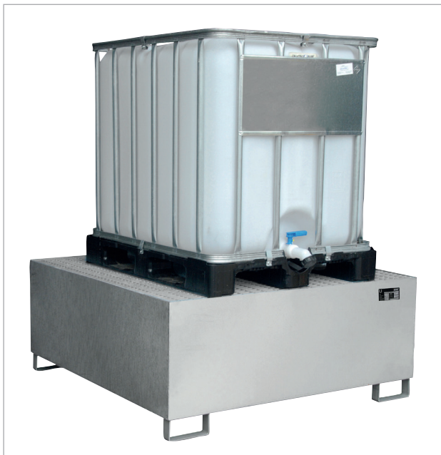
VAW-1000 avec caillebotis (options)