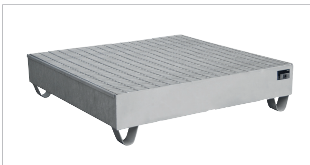
VAW-4/A avec caillebotis (options)