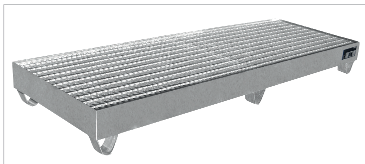
VAW-4/B avec caillebotis (options)