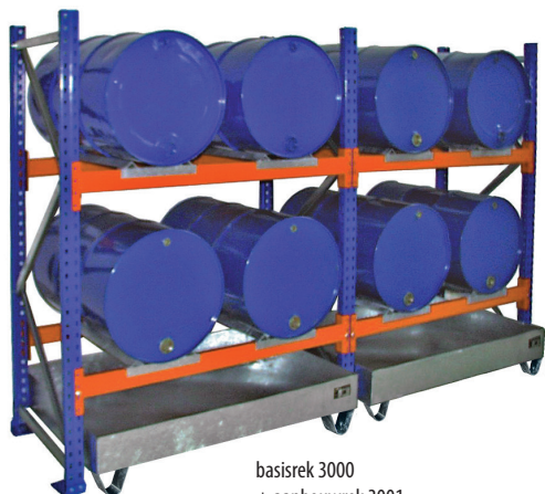
basisrek 3000 + aanbouwrek 3001