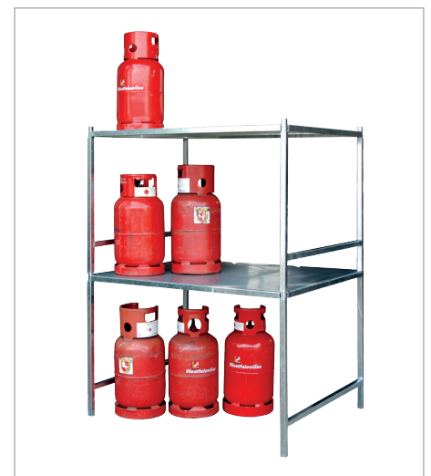
2x Typ GFG, gestapelt