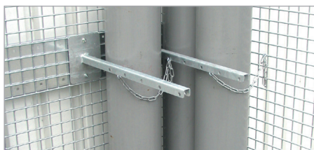
Dispositif de maintien des bouteilles de gaz de, sécurisé par chaîne.