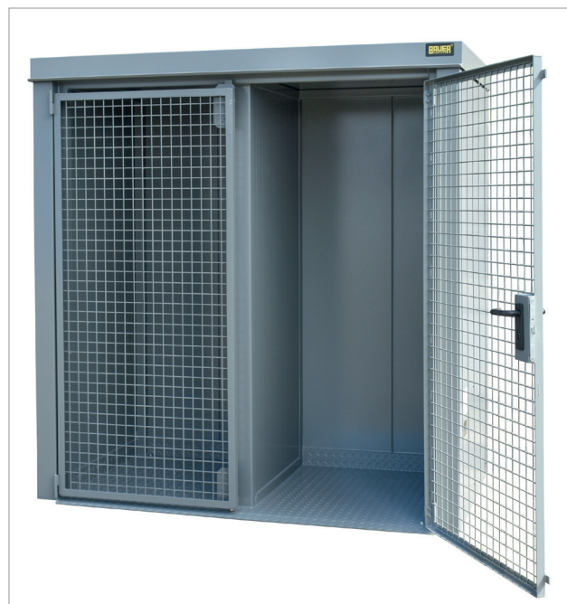
GFC-B avec cloison coupe-feu F 90