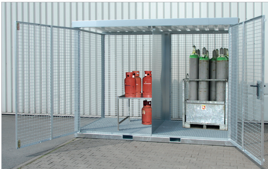
GFC-E/G M4 mit Trennwand (Zubehör)