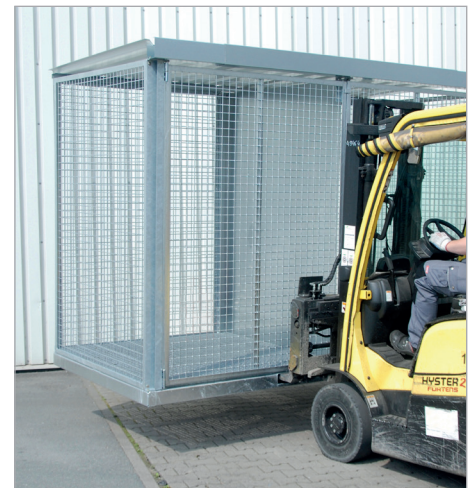
GFC-E/G met scheidingswand (optie)