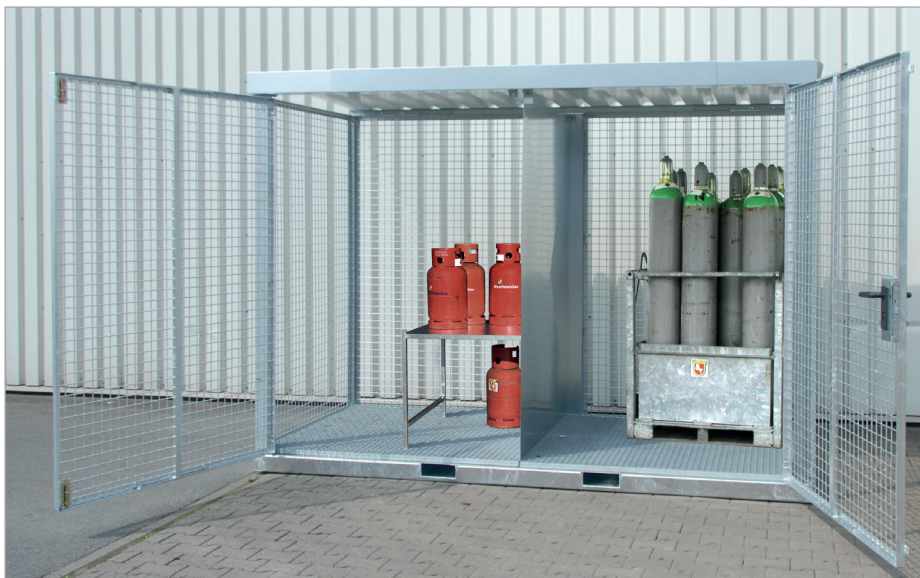
GFC-E/G (met scheidingswand) (optie)