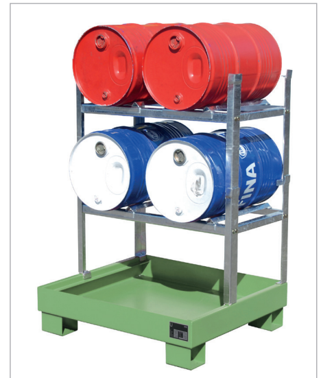
AW 60-2 + 2xAG 60-2 + 4xFA 60-A