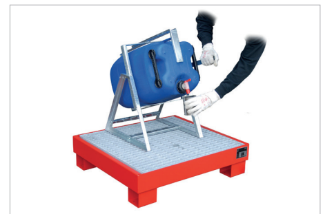
Aide au remplissage KAH-60 avec bac de rétention AW 60-2/M