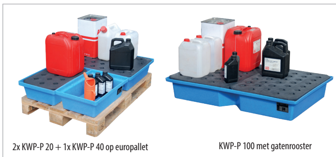
2x KWP-P 20 + 1x KWP-P 40 op europallet