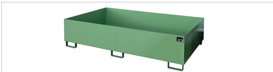
Bac de rayonnage RW 2200-2