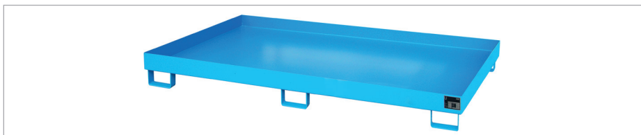
Bac de rayonnage RW 2200-1

Grâce à l'utilisation de bacs de rayonnage, les systèmes de rayonnages existants peuvent être équipés rapidement et économiquement conformément à la législation