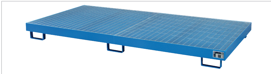
Bac de rayonnage RW-GR 2700-1