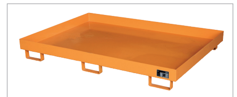
Bac de rayonnage RW 1800