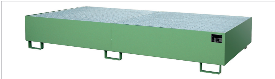
Rekopvangbak RW-GR 2700-3