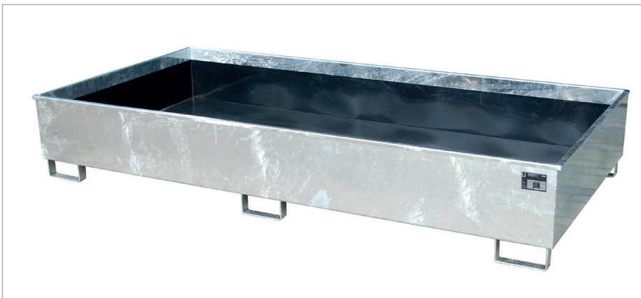
RW 2700-3 PE