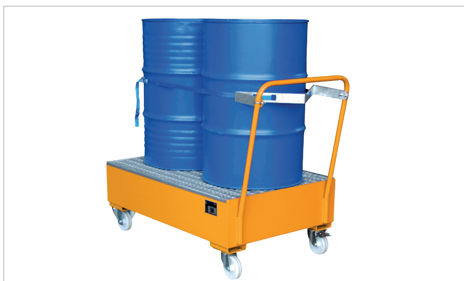
S 2020 met houder met spangordel (optie)