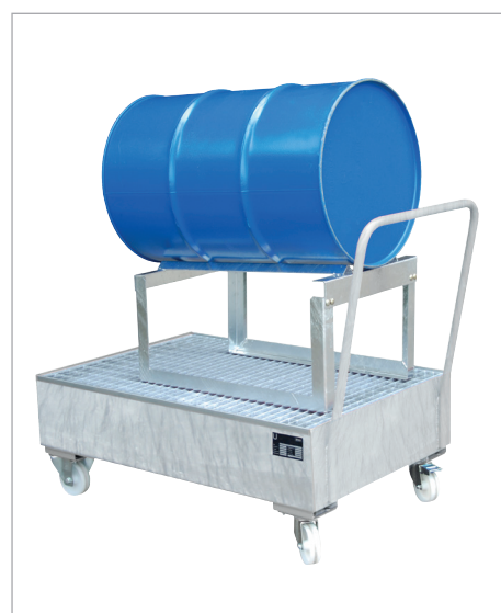
S 2021 met vatenrek type FA 200 (optie)