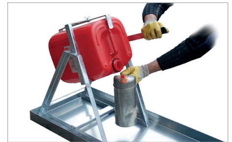
KGW 2 met jerrycan schenkulp KAH-25 (zie pagina 116)