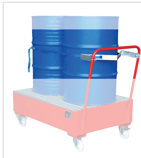
Sangle de serrage pour 2 fûts de 200 litres