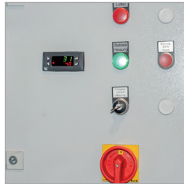
Schakelkast met digitale temperatuur-aanduiding